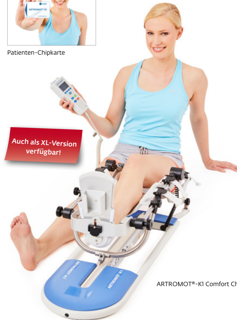
ARTROMOT®-K1 Comfort Chip