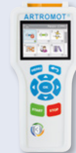
Hand-Programmiereinheit ARTROMOT® ACTIVE-K