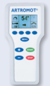
Hand-Programmereinheit ARTROMOT®-K1 Standard ARTROMOT®-K1 Comfort