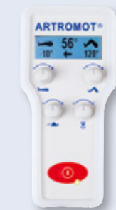
Hand-Programmereinheit ARTROMOT®-K1 Classic