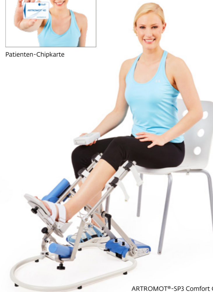
ARTROMOT®-SP3 Comfort Chip