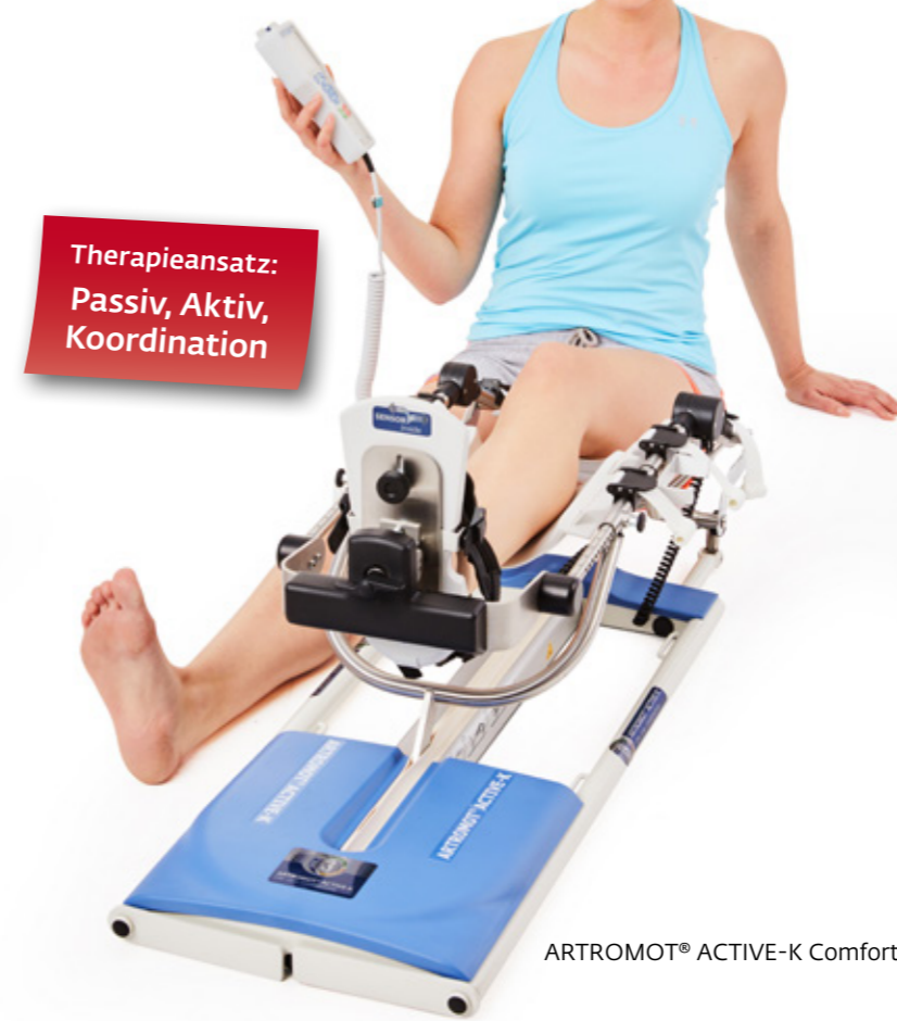
ARTROMOT® ACTIVE-K Comfort Chip